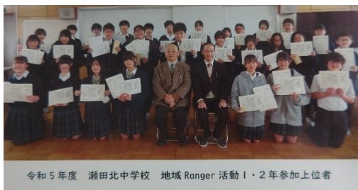
令和5年度 瀬田北中学校 地域Ranger活動1・2年参加上位者