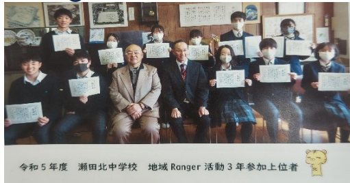
令和5年度 瀬田北中学校 地域Ranger活動3年参加上位者